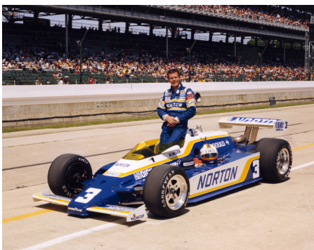
บ็อบบี้ อันเซอร์ (Bobby Unser)

รายงานฉบับนี้จัดทำขึ้นโดยข้อมูลเท่าที่ปรากฏและเชื่อว่าเป็นที่น่าเชื่อถือได้แต่ไม่ถือเป็นการยืนยันความถูกต้องและความสมบูรณ์ของข้อมูลนี้ๆ โดยบริษัทหลักทรัพย์ ยูเอสบี เคย์ ฮีเนียน (ประเทศไทย) จำกัด (มหาชน) ผู้จัดทำ ขอสงวนสิทธิ์ในการเปลี่ยนแปลงความเห็นหรือประมาณการณต่างๆที่ปรากฏในรายงานฉบับนี้ โดยไม่ต้องแจ้งล่วงหน้า รายงานฉบับนี้มีวัตถุประสงค์เพื่อใช้ประกอบการตัดสินใจของนักลงทุน โดยไม่ได้เป็นการชี้นำชักชวนให้นักลงทุนทำการซื้อหรือขายหลักทรัพย์ หรือตราสารทางการเงินใดๆ ที่ปรากฏในรายงาน